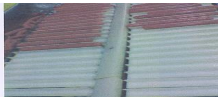
Después de la limpieza con D-ECO