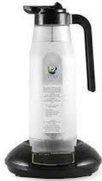
Jarra y base