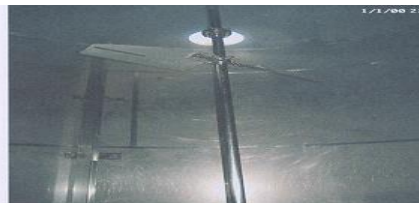
Después de la limpieza con D-ECO